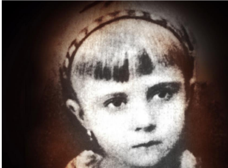
Ivana s četiri godine

Ivana Brlić-Mažuranić rodila se u Ogulinu, u obitelji intelektualaca. Ivanin otac, Vladimir Mažuranić bio je pravnik i pisac, a djed pjesnik i hrvatski ban Ivan Mažuranić.