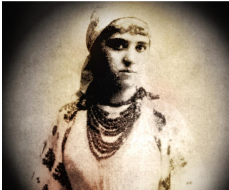
Ivana s 14 godina

Ivana Brlić-Mažuranić rodila se u Ogulinu, u obitelji intelektualaca. Ivanin otac, Vladimir Mažuranić bio je pravnik i pisac, a djed pjesnik i hrvatski ban Ivan Mažuranić.