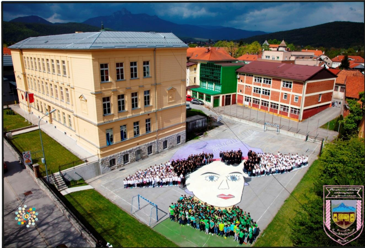
OŠ Ivana Brlić Mažuranić - Sinci smo Kléka, viřina jeka, svoji na svom- 556. Milenijska řime Strikomana

Osnovna škola Ivane Brlić-Mažuranić Ogulin