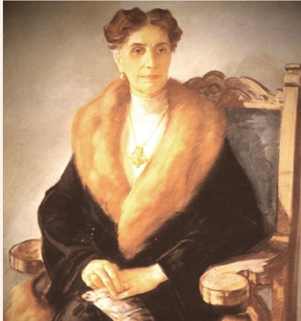
Ivanin portret iz 1936. godine

Čak četiri puta nominirana je za Nobelovu nagradu: 1931., 1935., 1937. i 1938. godine. Pisala je do 1937. godine. Te godine izabrana je za članicu Jugoslavenske akademije znanosti i umjetnosti. Bila je prva žena članica Akademije. Zbog dugotrajne borbe s depresijom počinila je samoubojstvo 21. rujna 1938. godine u Zagrebu.